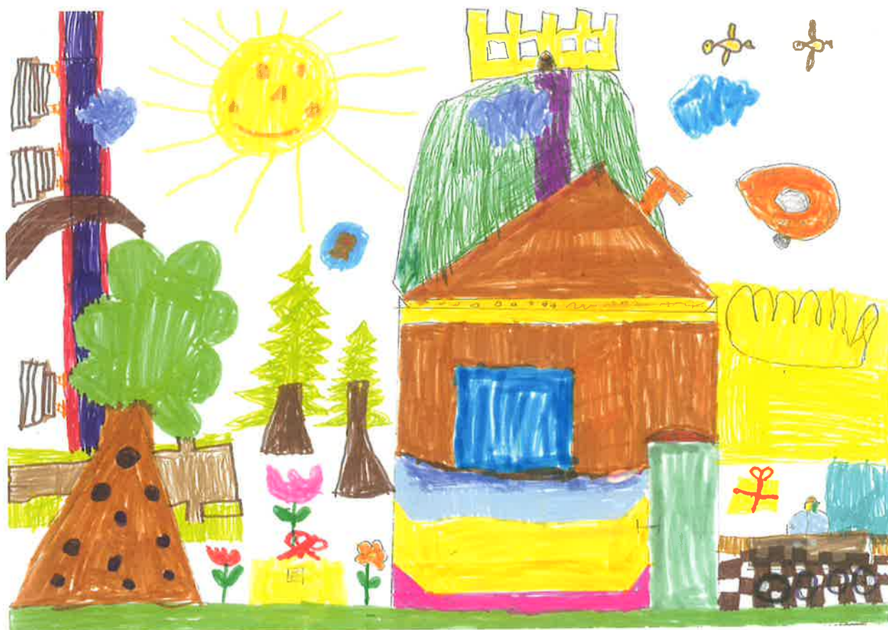
Hrad a podhradie II.