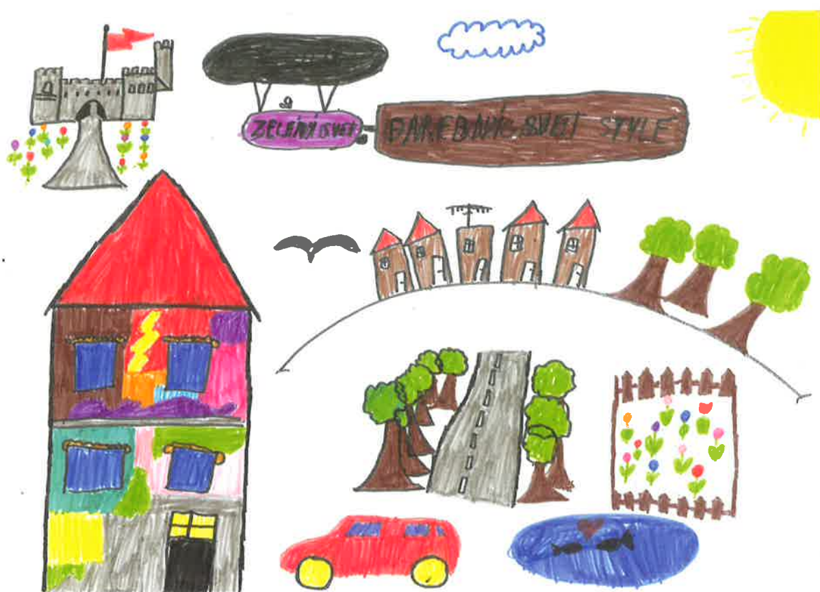
Hrad a Podhradie I.

Kráľovná Mária Terézia usporiadala v roku 1764 na svoje meniny ples na Bratislavskom hrade. Dvorné dámy v širokých šatách s pevnými kruhovými obručami spôsobne tancovali menuet, párový tanec takmer bez dotyku. Mária Terézia však zavolaala aj cigánsku cimbalovú kapelu a tí zrazu zahrli temperamentné uhorské ľudové tance. Do skorého rána vydržala tancovať len kráľovná.