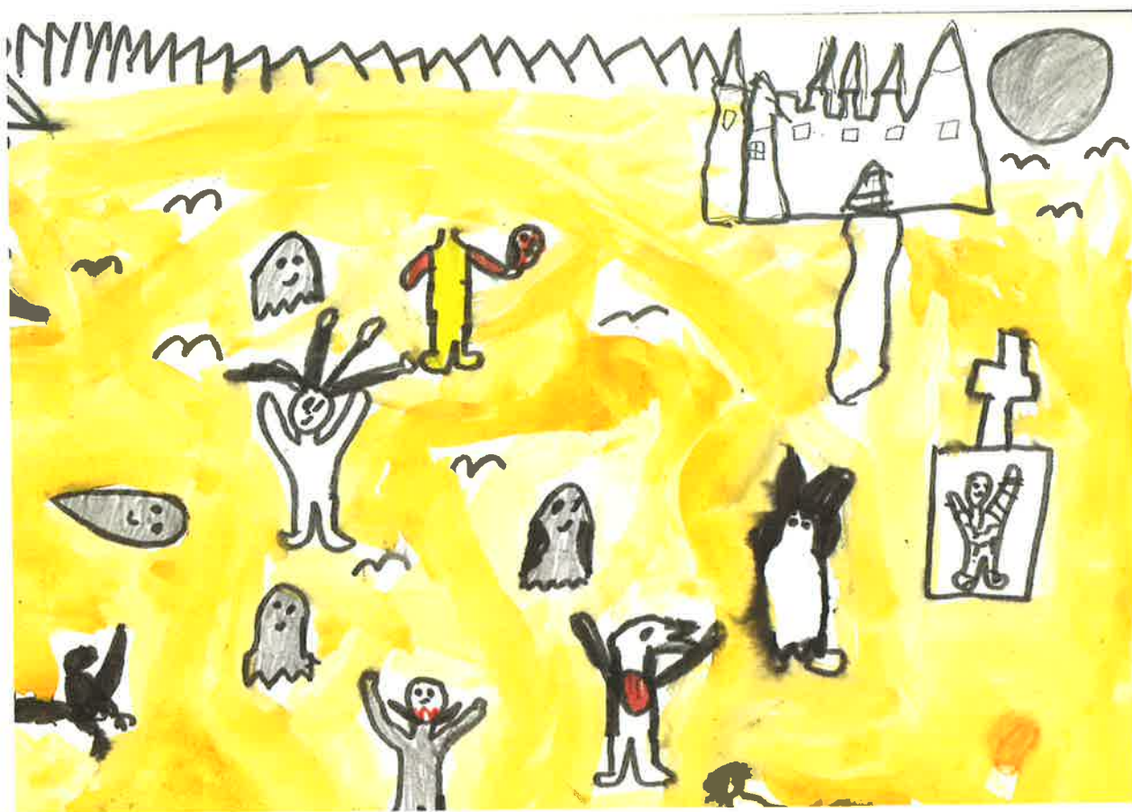
Ríša strašidiel na Bratislavskom hrade