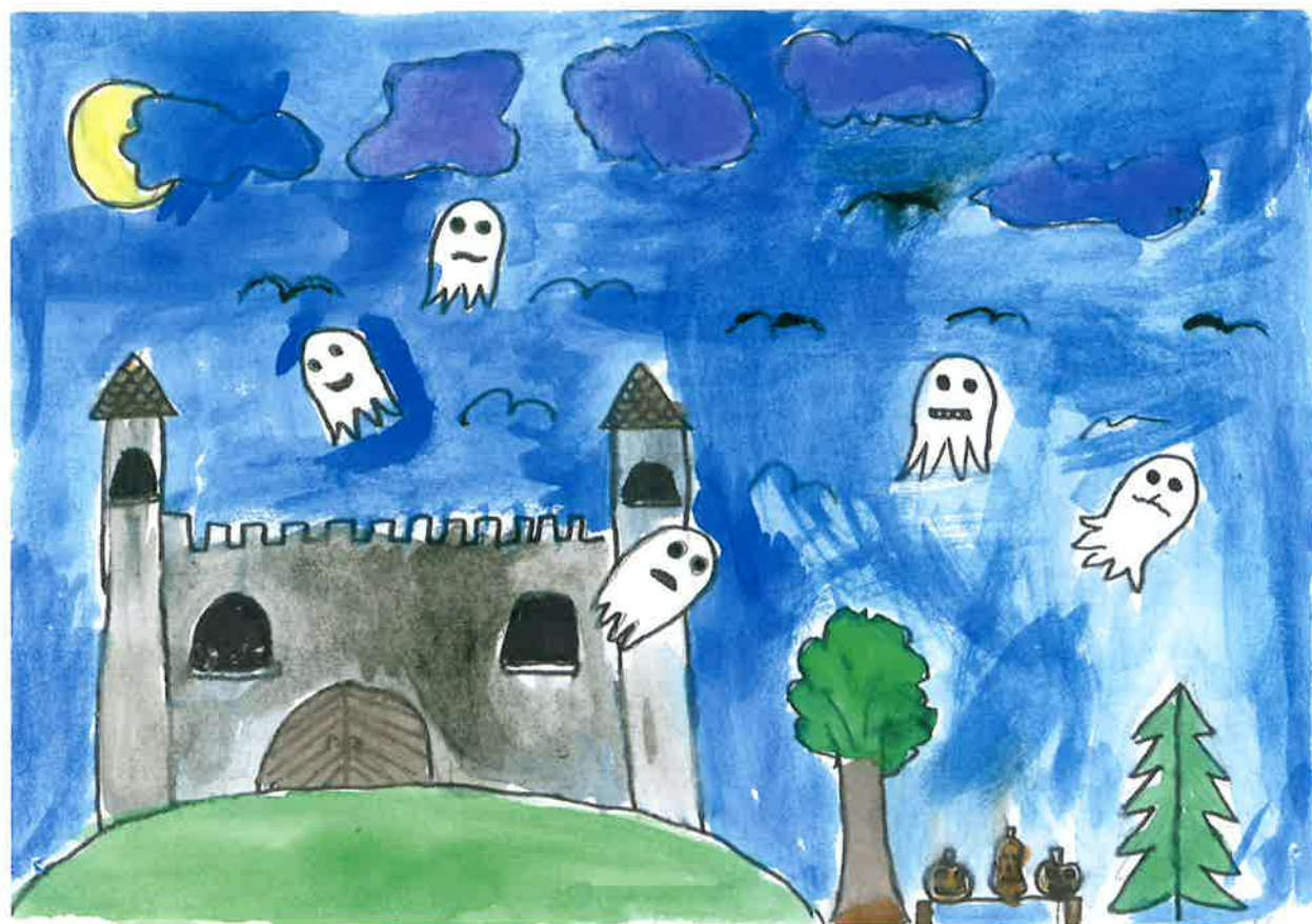
Hrad a strašidlá