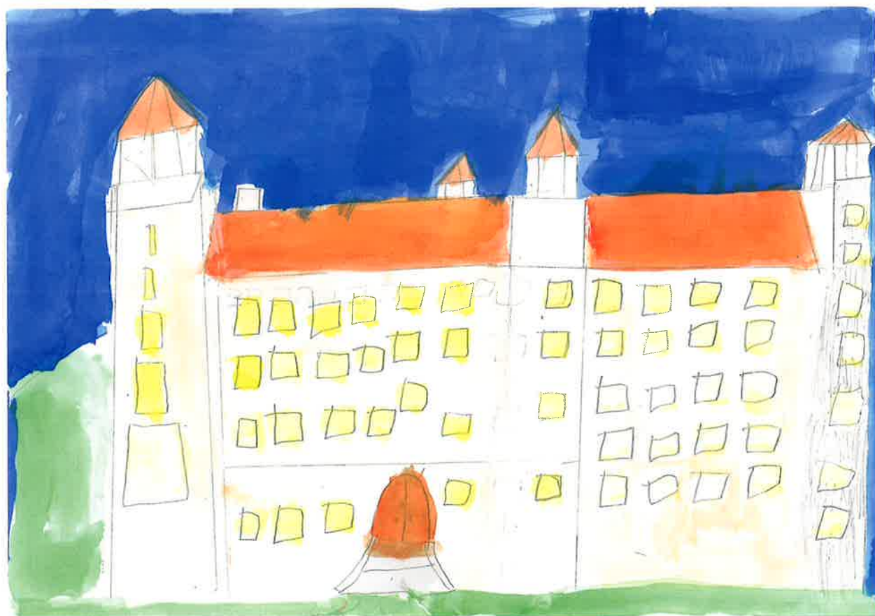
Bratislavský hrad pri zatmení slnka

Bratislavský župan Pavol Pálfi dal v 17. storočí pristaviť 3. poschodie a 3 vežičky